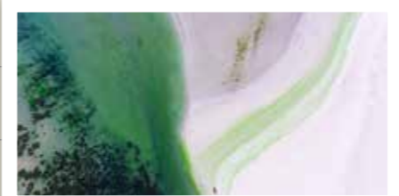
Playa de Vilarrube (Valdoviño)

Municipio conocido como la villa de los cien ríos y por albergar en el pasado una importante mina de lignito. Destaca el merecido protagonismo de sus antiguos puentes. Su lago artificial ejemplifica cómo un paisaje industrial puede convertirse en un hermoso espacio natural.