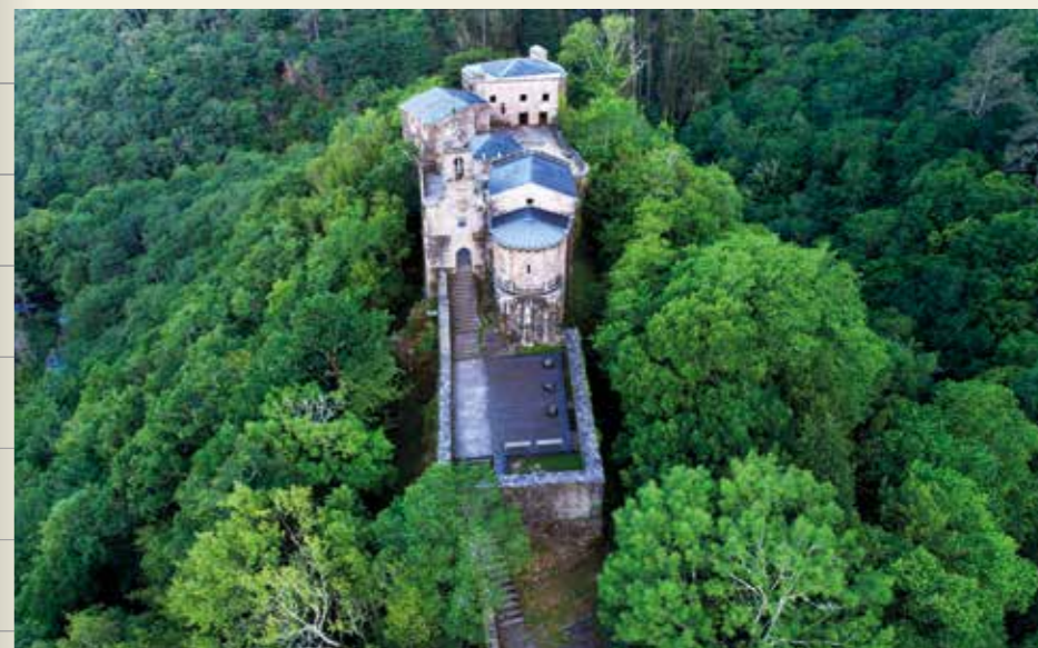
Monasterio de Caaveiro (A Capela)