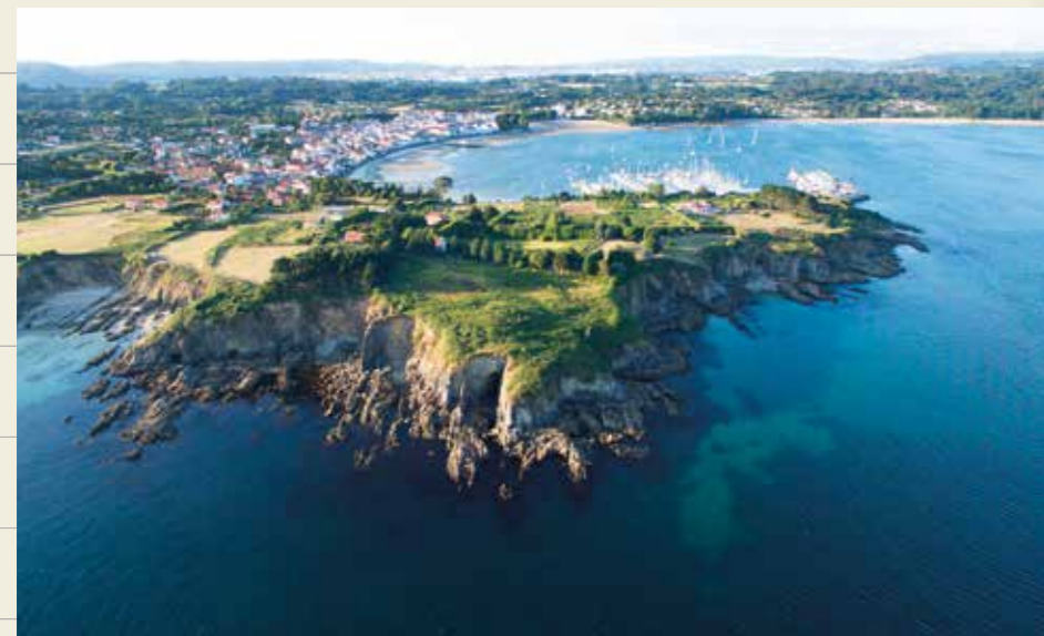
Ría de Ares