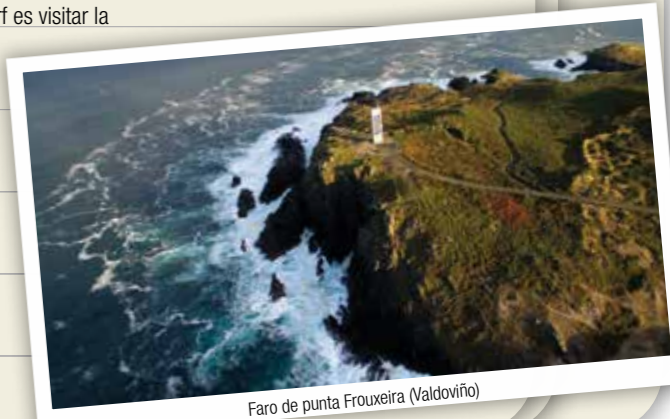
Faro de punta Frouxeira (Valdoviño)

La tipología arquitectónica que cabe destacar en Vilarnaíor es la que se refiere al patrimonio religioso. El ejemplo más destacado es Santa María de Doroiña, y los numerosos molinos distribuidos por todo su territorio, como el de Pegueiro o el del Medio.