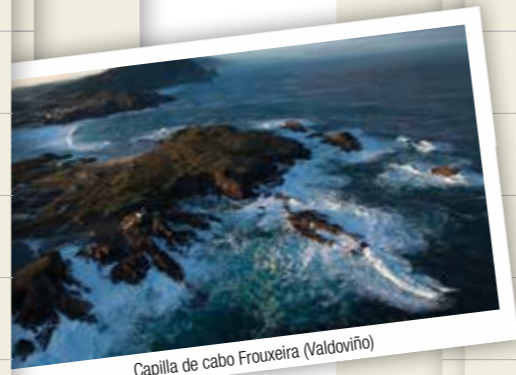
Capilla de cabo Frouxeira (Valdoviño)