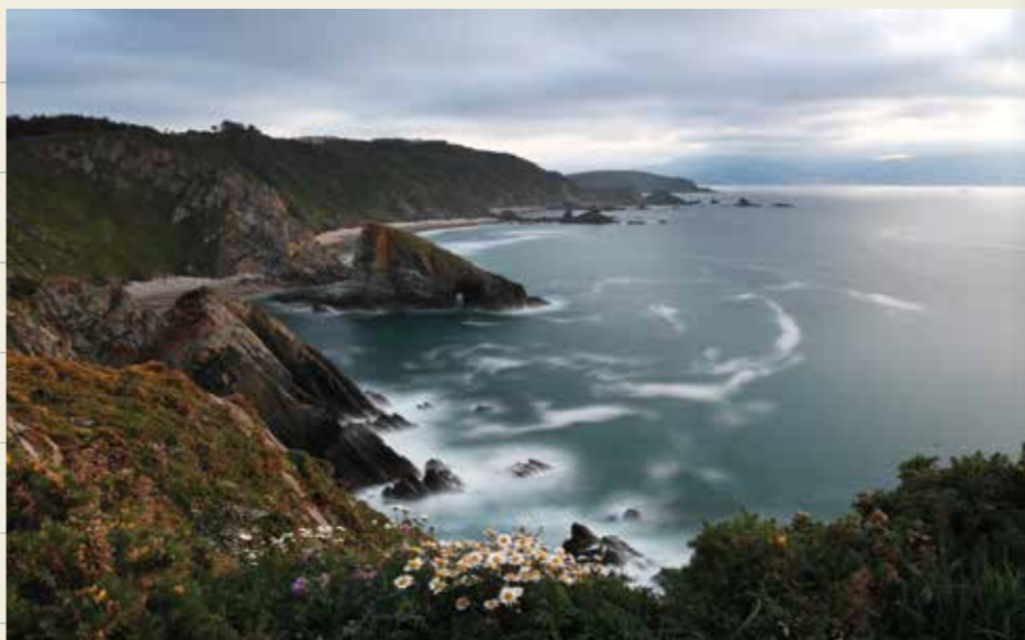
Acantillados de Loiba (Ortigueira)