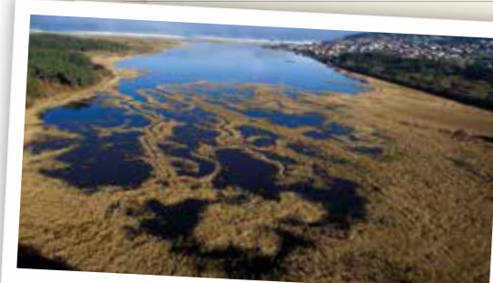
Laguna de Valdoviño