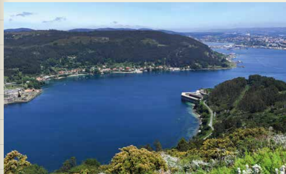
Ría de Ferrol