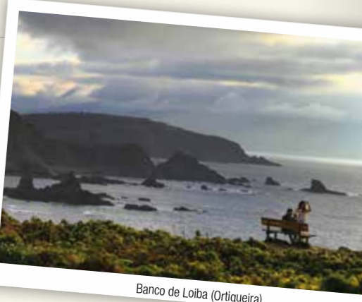
Banco de Loiba (Ortigueira)

El pan de Neda, el pulpo de Mugardos, el pimiento de O Couto... son los reyes de la gastronomía con apellidos en Ferrolterra y como tal cada uno tiene su propia fiesta o romería. Son los más famosos pero no los únicos en el que conviven el percebe de Cedeira, el grelo de Cerdido, la miel de As Pontes, el requesón de A Capela, la almeja de Maniños o el mejillón de Barallobre.