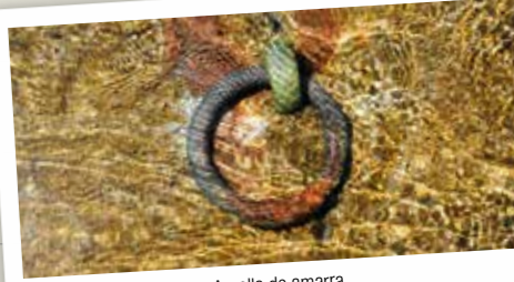
Argolla de amarra

Ferrol y A Coruña son puntos de partida del conocido Camino Inglés, que discurre por el norte de la provincia. Bien partiendo de Ferrol o de A Coruña, con casi 120 y 75 km por delante respectivamente, los dos caminos se unen en los alrededores de Mesía para seguir hasta Santiago de Compostela. Su nombre se debe a que era la ruta