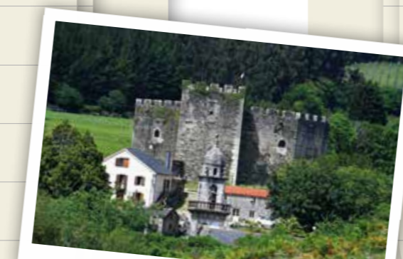
Castillo de Moeche