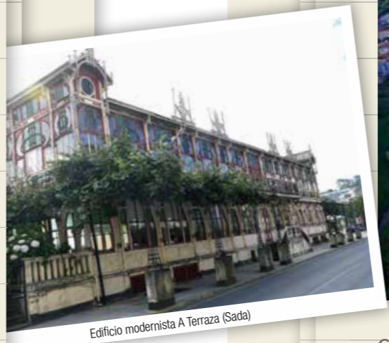
Edificio modernista A Terraza (Sada)