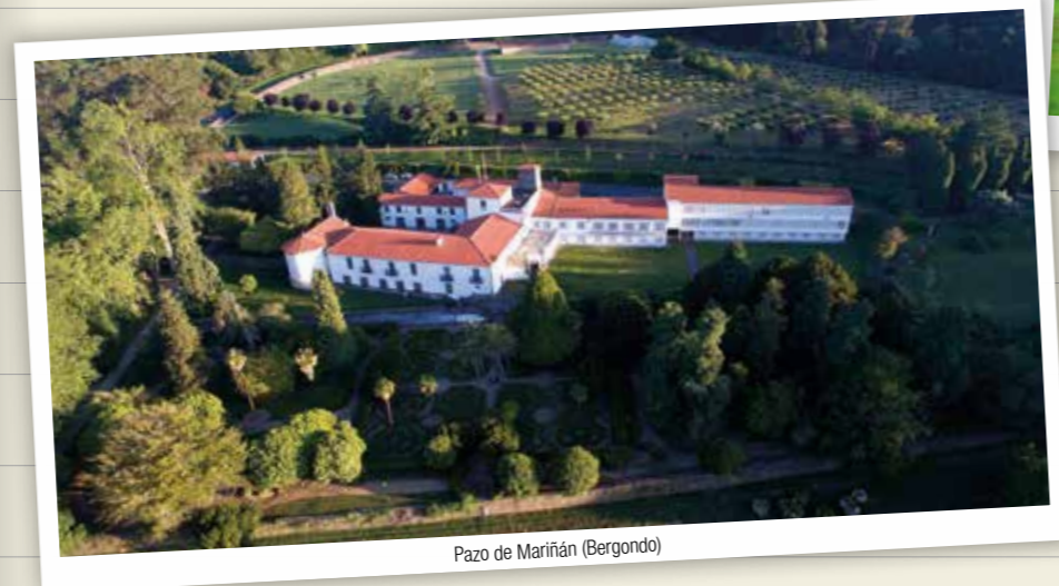
Pazo de Mariñán (Bergondo)