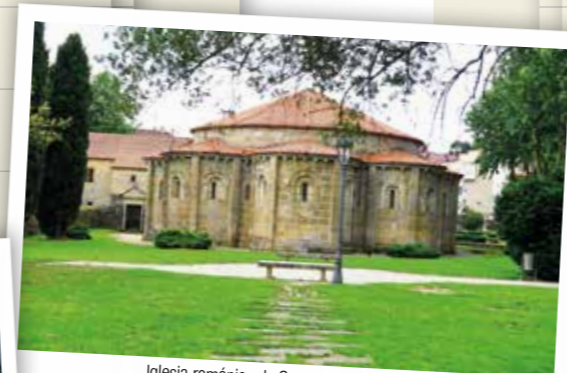
Iglesia románica de Santa María (Cambre)

Reconocido por la excepcionalidad de su pan y su antigua tradición así como por su empanada, otra estrella de la gastronomía local. Además cuenta con un gran área recreativa situada en los alrededores del monte Xalo desde donde disfrutar de una espectacular panorámica.