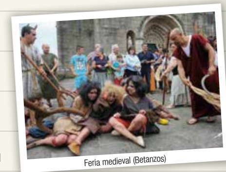
Feria medieval (Betanzos)

Las ferias medievales de A Coruña o Betanzos, con su perfecta recreación histórica, nos llevan a los tiempos de los mercaderes, los señores feudales o de los juglares con sus cantares.