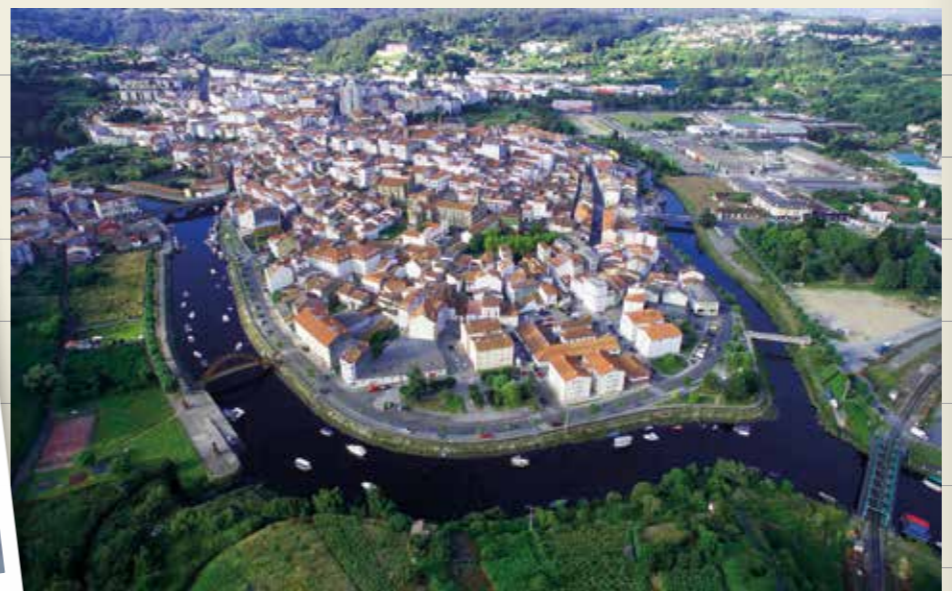
Vista aérea de la señorial villa de Betanzos