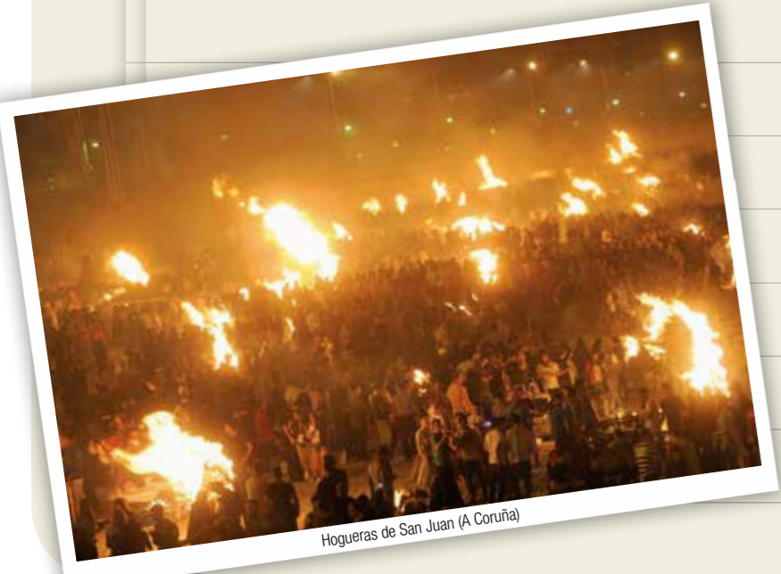
Hogueras de San Juan (A Coruña)