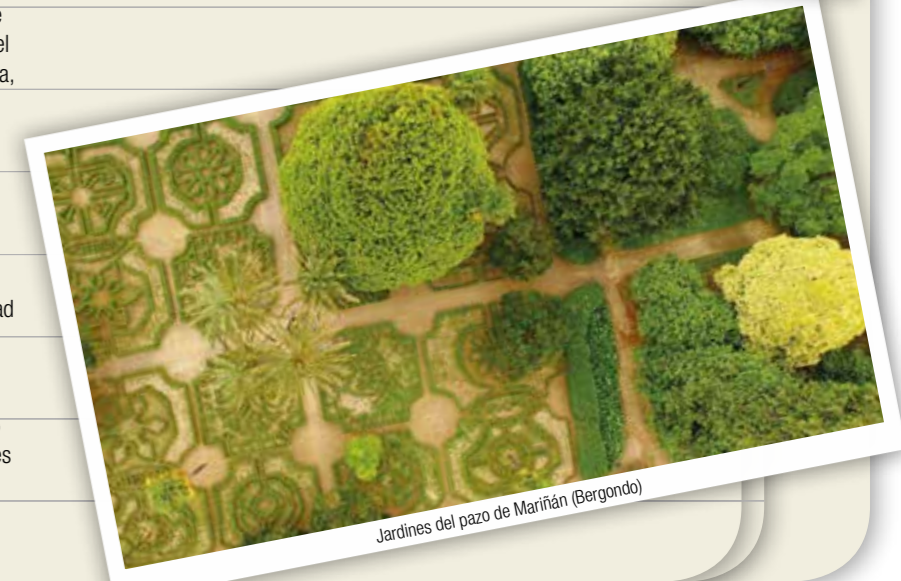
Jardines del pazo de Mariñán (Bergondo)