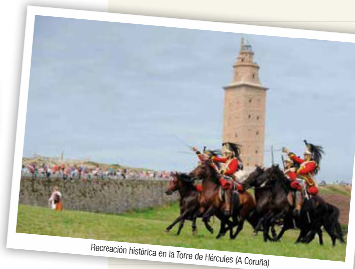
Recreación histórica en la Torre de Hércules (A Coruña)

A Coruña y As Mariñas reúnen lo mejor de la tradición y de la vanguardia gastronómica gallega. Los más laureados restaurantes de autor conviven con tabernas y casas de comidas en las que el denominador común es la altísima calidad de la materia prima al alcance de todos los bolsillos.