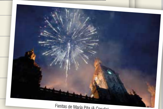
Fiestas de María Pita (A Coruña)

Representa uno de los enclaves turísticos y marineros más importantes del litoral norte de Galicia. En estas tierras conviven mezcladas nobles torres con casas de pescadores y edificios modernistas como es la Terraza.