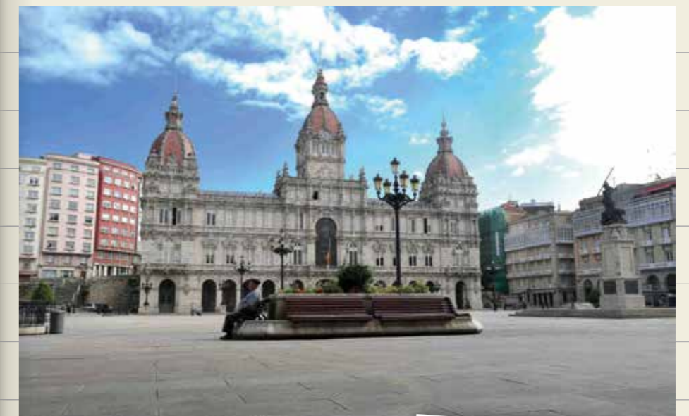
Plaza de María Pita y palacio municipal (A Coruña)