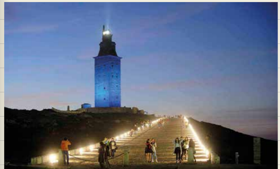
Torre de Hércules (A Coruña)