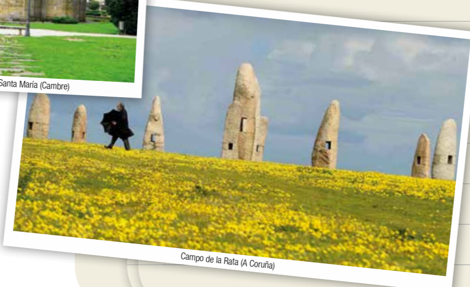
Campo de la Rata (A Coruña)