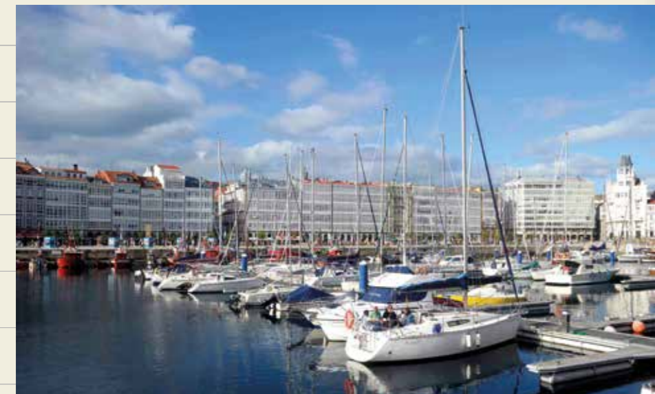
Dársena de A Coruña con las características galerías de la Marina de fondo