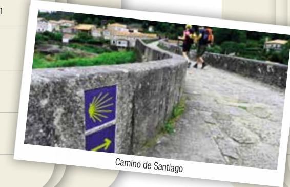
Camino de Santiago