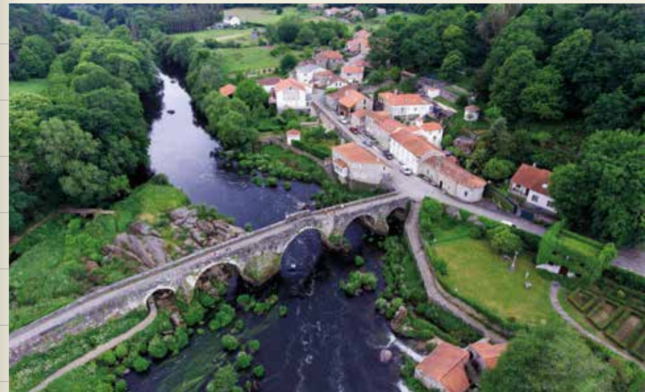
Ponte Maceira (Negreira)