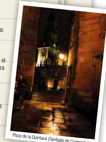
Plaza de la Quintana (Santiago de Compostela)