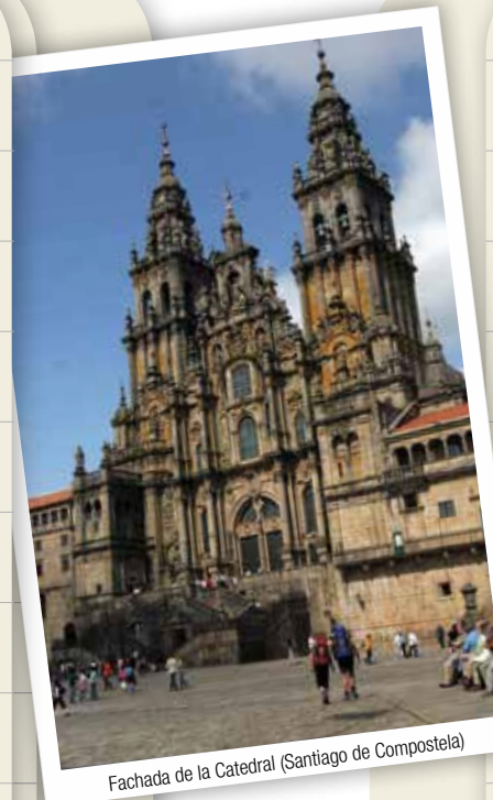
Fachada de la Catedral (Santiago de Compostela)