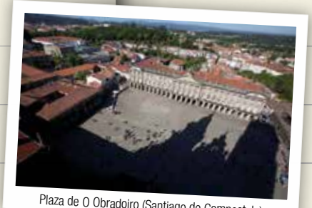
Plaza de O Obradoiro (Santiago de Compostela)