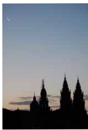
Atardecer en Santiago

El tributo a nuestras letras encuentra sus grandes exponentes en la Casa-Museo Rosalía de Castro, en Padrón, y también en esta localidad la Fundación Pública Gallega Camilo José Cela, dedicada a la figura y obra del Nobel gallego.