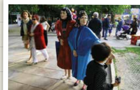
Alameda (Santiago de Compostela)

Si el patrimonio cultural es amplio, la oferta gastronómica en las Tierras de Santiago aún lo es más. Los amantes de la buena mesa pueden probar muchos productos típicos, como la famosa tarta de Santiago, el pulpo de Melide, el queso de Arzúa-Ulloa, el aguardiente de Vedra, las filloas de Lestedo, las truchas de Oroso, los champiñones de Ordes, el pimiento de Herbón, el galo piñeiro de O Pino... Casi todas estas delicias tienen asociadas su propia fiesta gastronómica, algunas de ellas de interés turístico, junto con otras importantes como la Exaltación del Vino da Ulla en Vedra, la Fiesta del Melindre en Melide, la del Cordero al Espeto en San Julián de Sales (Vedra) o la del cochinillo en Cerceda.