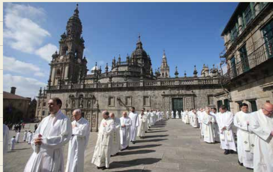
Santiago de Compostela