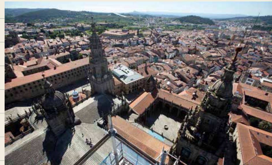
Panorámica de la Catedral y la ciudad de Santiago de Compostela