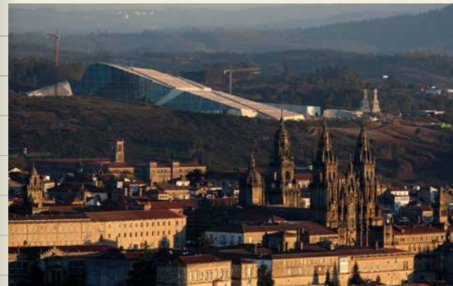
Ciudad de la Cultura de Galicia (Santiago de Compostela)