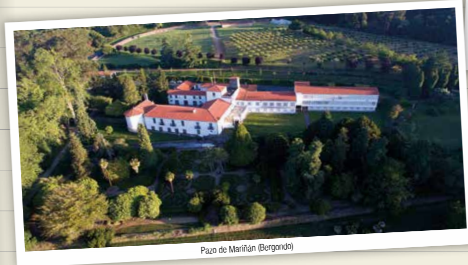
Pazo de Mariñán (Bergondo)