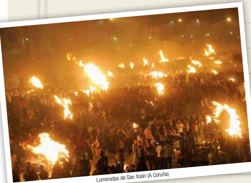
Lumeradas de San Xoán (A Coruña)