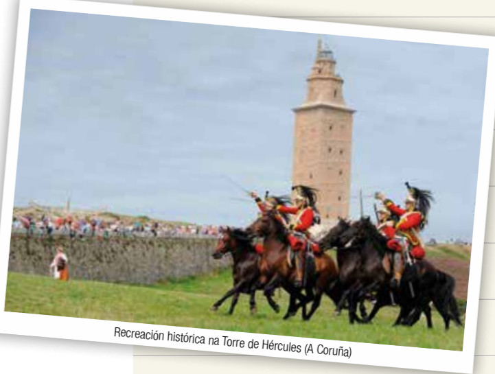
Recreación histórica na Torre de Hércules (A Coruña)

A Coruña e as Mariñas reúnen o mellor da tradición e da vangarda gastronómica galega. Os máis laureados restaurantes de autor conviven con tabernas e casas de comidas nas que o denominador común é a altísima calidade da materia prima ao alcance de todos os petos.