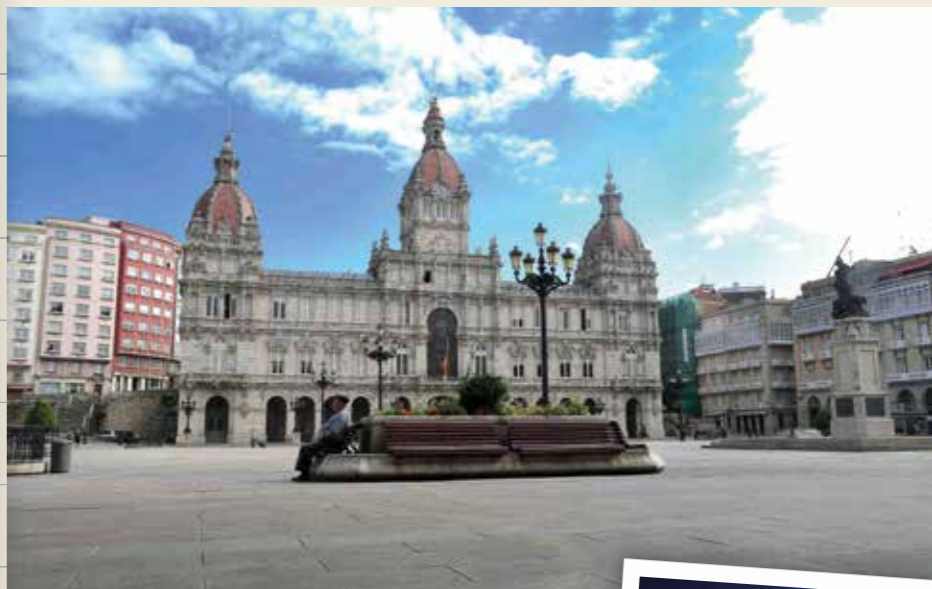
Praza de María Pita e pazo municipal (A Coruña)