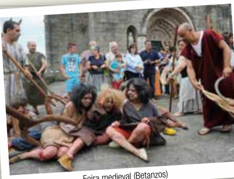
Feira medieval (Betanzos)

As feiras medievais da Coruña ou Betanzos, coa súa perfecta recreación histórica, lévannos aos tempos dos mercadores, os señores feudais ou dos xogroses cos seus cantares.