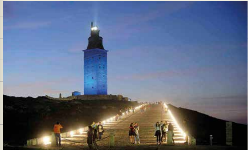
Torre de Hércules (A Coruña)