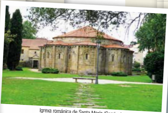
Igrexa románica de Santa María (Cambre)

Municipio coñecido pola excepcionalidade do seu pan e a súa antiga tradición así como pola súa empanada, outra estrela da gastronomía local. Ademais conta cunha gran área recreativa situada nos arredores do monte Xalo desde onde gozar dunha impresionante panorámica.