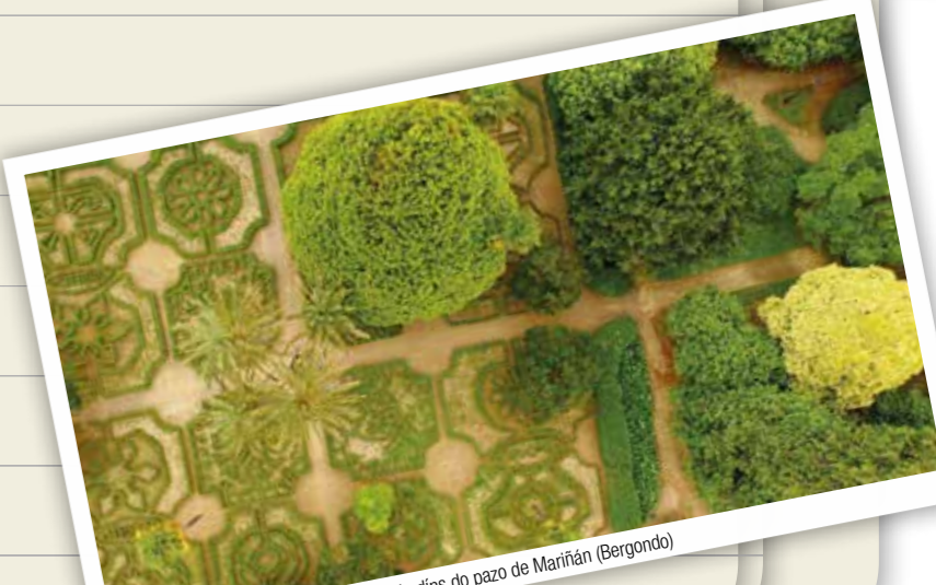
Xardíns do pazo de Mariñán (Bergondo)