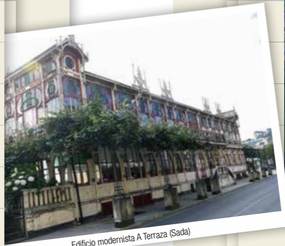
Edificio modernista A Terraza (Sada)