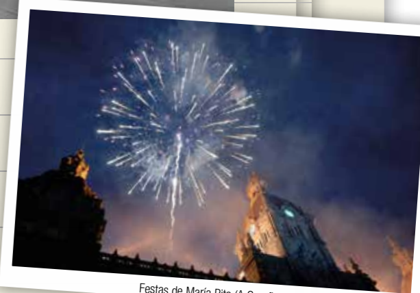
Festas de María Pita (A Coruña)

Representa un dos enclaves turísticos e mariñeiros máis importantes do litoral norte de Galicia. Nestas terras conviven mesturadas nobres torres con casas de pescadores e edificios modernistas, como a Terraza.