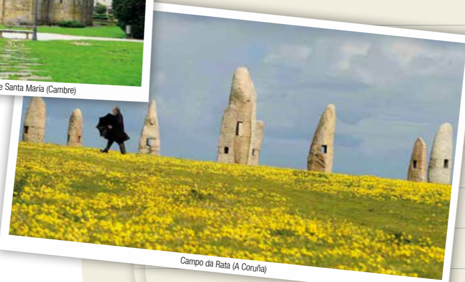
Campo da Prata (A Coruña)