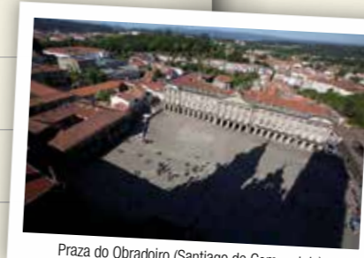
Praza do Obradoiro (Santiago de Compostela)