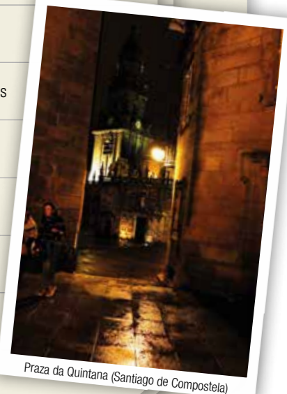
Praza da Quintana (Santiago de Compostela)