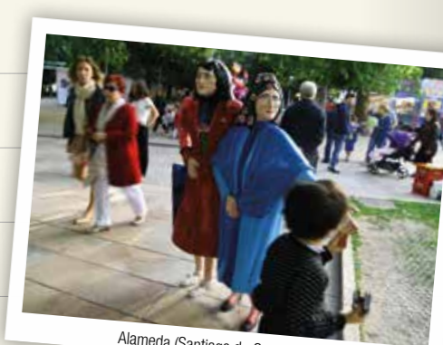
Alameda (Santiago de Compostela)

Se o patrimonio cultural é amplo, a oferta gastronómica nas Terras de Santiago aínda o é máis. Os amantes da boa mesa poden probar moitos produtos típicos, como a famosa torta de Santiago, o polbo de Melide, o queixo Arzúa-Ulloa, a augardente de Vedra, as filloas de Lestedo, as troitas de Oroso, os champiñóns de Ordes, o pemento de Herbón, o galo piñeiro do Pino... Case todas estas delicias teñen asociadas a súa propia festa gastronómica, algunhas delas de interese turístico, xunto con outras importantes como a Exaltación do Viño da Ulla en Vedra, a Festa do Melindre en Melide, a do Carneiro ao Espeto en San Xulián de Sales (Vedra) ou a do cochiño en Cerceda.