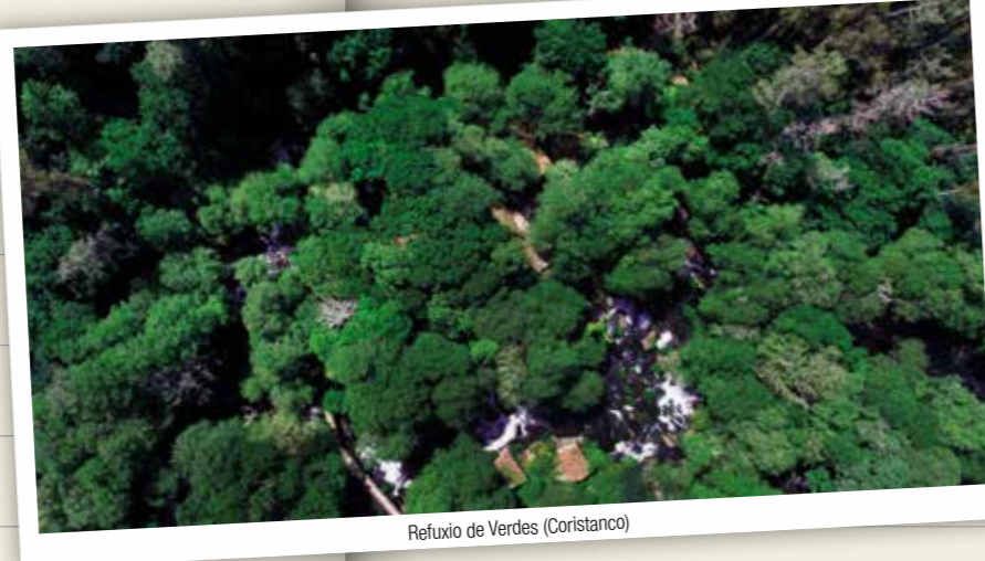
Refuxio de Verdes (Coristanco)