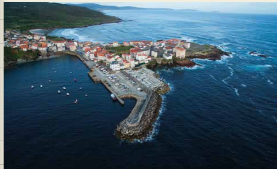
Vila mariñeira de Caión (A Laracha)