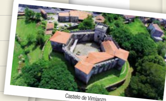
Castelo de Vimianzo