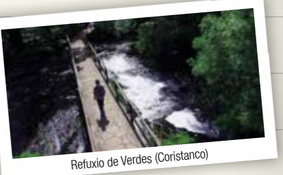
Refuxio de Verdes (Coristanco)

O Camiño de Santiago non remata para todos os peregrinos na cidade compostelá. Moitos deles deciden percorrer a pé os 90 quilómetros que separan Santiago de Fisterra. Aquí, a tradición obriga a queimar algunha peza de roupa que se levou durante as etapas como símbolo de renovación interior que todo peregrino sofre durante o camiño. Quéimase o vello para dar cabida ao novo, xa que como di a tradición, Fisterra é un lugar de finais, pero tamén de comezos.