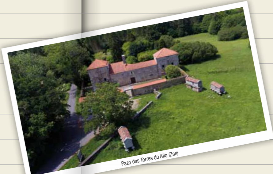
Pazo das Torres do Allo (Zas)