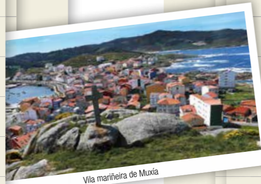
Vila mariñeira de Muxía