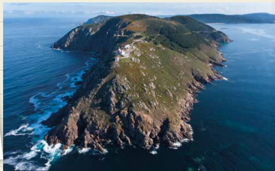
Vista aérea do faro do cabo Fisterra