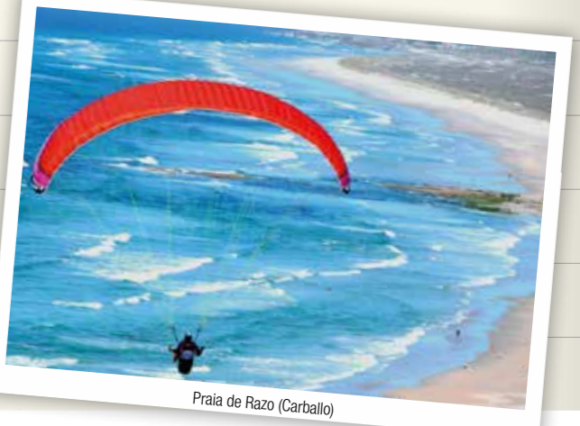
Praia de Razo (Carballo)

Na Costa da Morte destacan as celebracións de San Xoán de Carballo, a Barca de Muxía, os Milagres de Caión, o naufraxio de Laxe ou a Carballreira de Zas na súa vertente máis tradicional, xunto con propostas máis innovadoras como Con V de Valarés ou o festival do Nordeste Rock de Malpica.