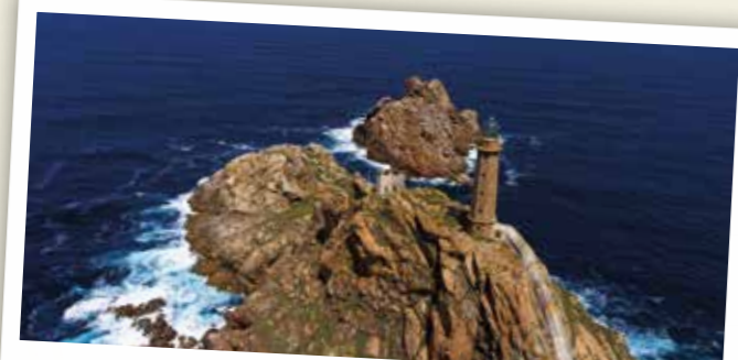
Faro de cabo Vilán (Camariñas)

O río Grande discorre polo norte e o Xallas polo sur, con numerosas mostras do megalitismo como o dolmen de Arca da Piosa e o seu patrimonio cultural coma Torres do Allo ou a ponte de Brandomil. O seu municipio de Baio é coñecido pola súa característica fía do liño.