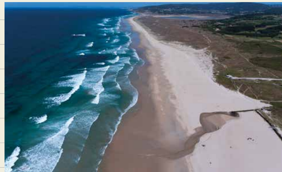
Praia de Razo (Carballo)