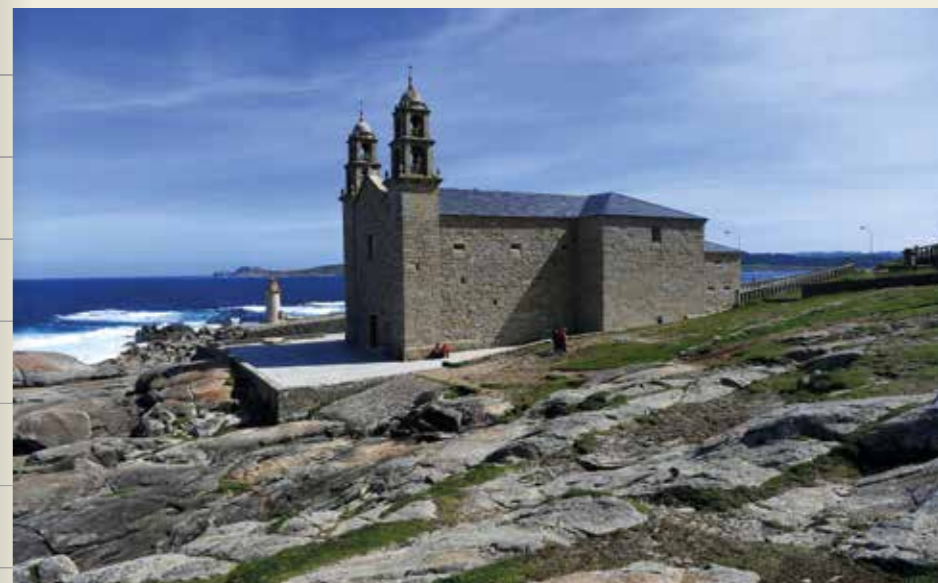
Santuario da Virxe da Barca (Muxía)