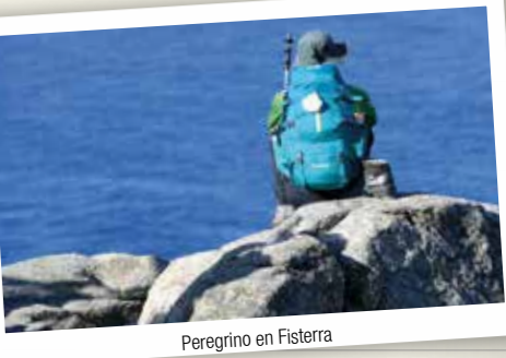
Peregrino en Fisterra

Praias desertas, enseadas e acantilados. O océano bravo, as augas axitadas e unha paisaxe inconfundible son os sinais de identidade da Costa da Morte. Terra de misterio, lendas e mitos, a súa personalidade está marcada pola condición de fin do mundo, outorgada polos romanos. Ademais é unha das zonas máis ricas de Europa en mostras de cultura megalítica, cuns impresionantes cabos, como os de Fisterra, Touriñán e Vilán, que penetran nun océano salvaxe, mentres que cara o interior a terra forma suaves outeiros, tapizados de campos de millo, pastos e forestas.